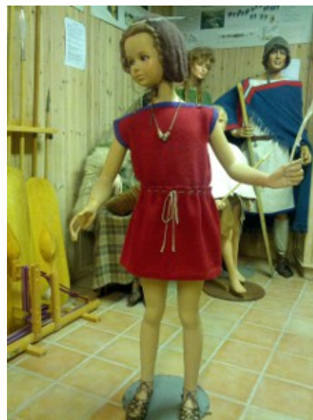
Vores lille pige.