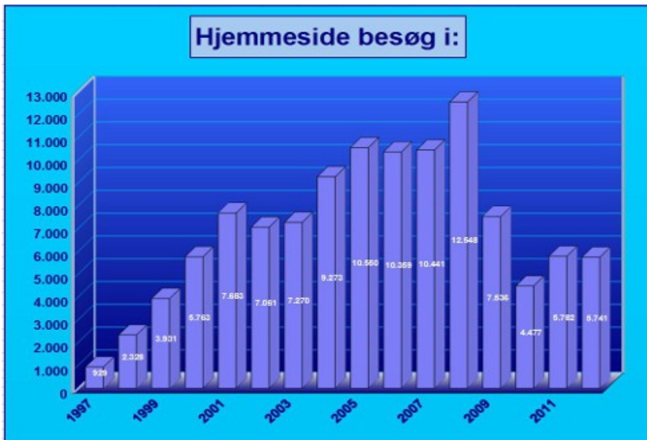
Årlige besøg fra 1997 til 2013