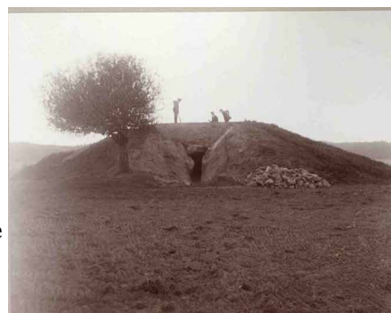
Meget smukt og velbevaret jættestue med karakteristisk beliggenhed på en højtliggende flade - nord for Tjele Langsø. Bigum-jættestuen betegnes som den mest seværdige jættestue i Viborg amt.

Måske er det dem der kommer med hesten til Danmark, vi ved det ikke bestemt, men vi ved, at de kommer, og at de næppe kommer helt fredeligt vandrende. Da de første bønder kom til landet, havde de stridsøkser med sig. De ny har stridsøkser med, så det batter. Ikke de første bønders smukke husflid, pænt formede smykker som må glæde enhver ynder af smukt arbejde, men noget helt andet: tomohawken par excellence, kraniehammeren, dræberen på skaft, morderøkser som kunstværk.