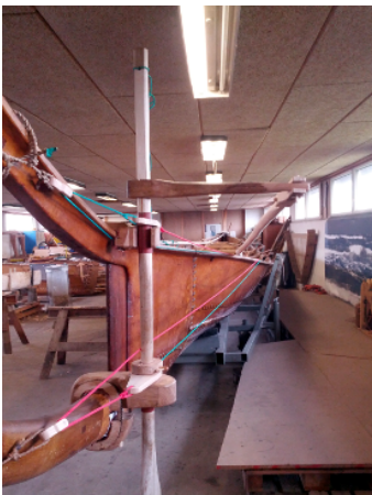
Det nye rorophæng

Det nye ror-system er færdigt og vi håber også at få påhængsmotor-ophænget færdigt i den nærmeste fremtid. Inden vi tager det i brug, er det nødvendigt, at der er en besætning, som er fortrolig med betjeningen af begge dele. Vi skal også gennemgå proceduren ved søsætning/optagning af Tilia. En del af dette kan foregå, mens Tilia befinder sig i Lindeværftet. Vi håber derfor, at de besætningsmedlemmer, som vil sejle med Tilia, vil møde de kommende tirsdage for at deltage i dette.