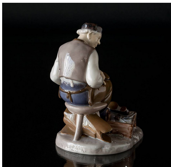
Kai Nielsens stenfigurer.