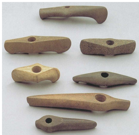
Eksempler på stridsøkser

Det ny folk kommer vel ikke i begyndelsen overvældende talrigt, men op i Jylland kommer de, og deres grave røber dem, enkeltgrave, hver mand i sin grav. De er individualister, og deres gravform siger det, i modsætning til jættestuens fællesskab.