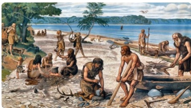
Livet i yngre stenalder.