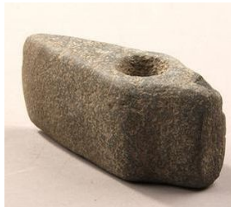
Lerkar og stridsøkser fra Enkeltgravfolket/stridsøksefolket.