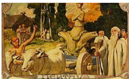
"Nerthus" af Emil Doepler (1905).

Et af de største spørgsmål, er Njords forbindelse til gudinden Nerthus , der beskrives af Tacitus i 1. århundrede e.v.t. "Nerthus" er en latiniseret udgave af det rekonstruerede germanske navn * Nerþus , dvs. "Nerthus" er den feminine udgave, af hvad Njörðr må have heddet i 1. århundrede. Forbindelsen bygger således på et lingvistisk slægtskab, men den direkte forbindelse mellem jernalderens Nerthus og vikingetidens Njord er ukendt, da hun ikke optræder i nogle af de yngre kilder, ligesom Njord ikke kendes fra den tidligere periode. Men det er bl.a. blevet foreslået, at guden har skiftet køn, tidligere har været opfattet som hermafrodit, eller at Nerthus er Njords søster og oprindelige hustru, hvis eksistens bl.a.