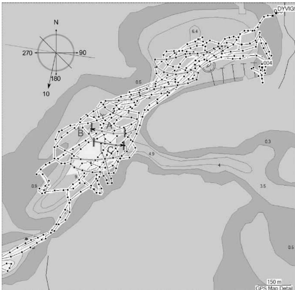
GPS-målinger dag 2