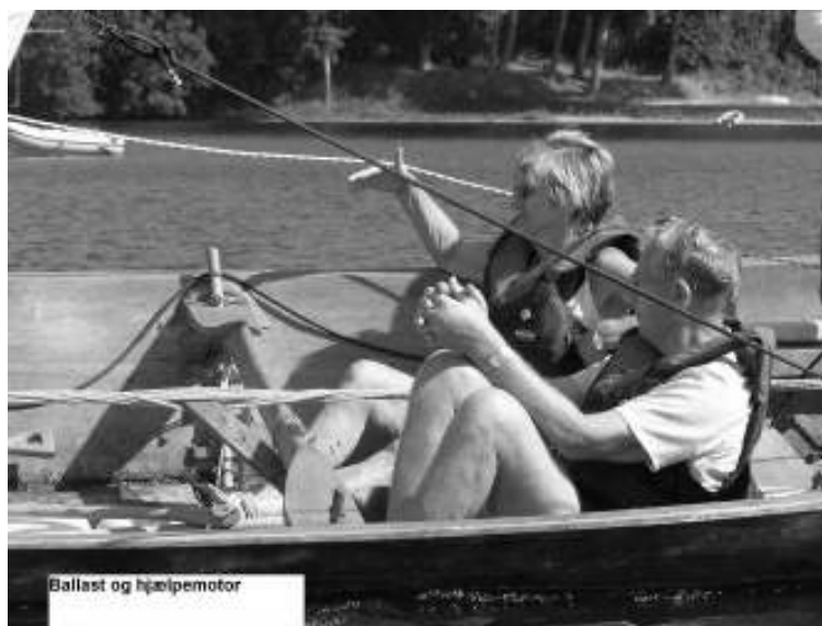
Ballast og hjælpemotor